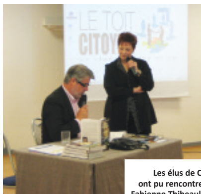
Les élus de CE ont pu rencontrer Fabienne Thibeault.

Outre la rencontre avec la très chaleureuse Fabienne Thibeault, à l'occasion de la sortie de son livre La fille du Saint-Laurent (Éditions du Moment), le sujet juridique du jour était l'égalité professionnelle, enfin obligatoire depuis la loi