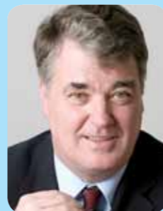
Jean-Paul DELEVOYE Président du Conseil économique, social et environnemental

Les entreprises doivent actuellement relever de front deux défis majeurs : leur compétitivité et le bien-être de leurs employés. Ces transitions rendent nécessaires plus que jamais au sein des entreprises les temps de décompression, d'empathie, d'écoute et d'échange. C'est pourquoi je soutiens cette initiative de la fête des voisins au travail.