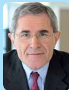
Gérard MESTRALLET PDG du groupe GDF-SUEZ, Président de la Fondation FACE

Avec ses 4 000 dirigeant-e-s, FACE développe les liens sociaux et territoriaux, en mobilisant les acteurs du travail. Proximité, altérité, égalité, réciprocité... sont aussi les valeurs de l'Entreprise. PME et grandes organisations sont de formidables lieux d'échanges, d'entraide et de cohésion. Notre engagement social et sociétal, doit contribuer à plus de solidarité interne et externe.